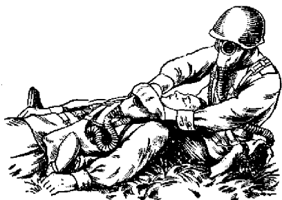
Рис. Надевание противогаса на раненого (вариант)

При надевании противогаса на раненого необходимо положить или посадить раненого, учитывая его состояние и обстановку , вынуть шлем-маску из сумки и надеть ее на голову раненого (рис.).