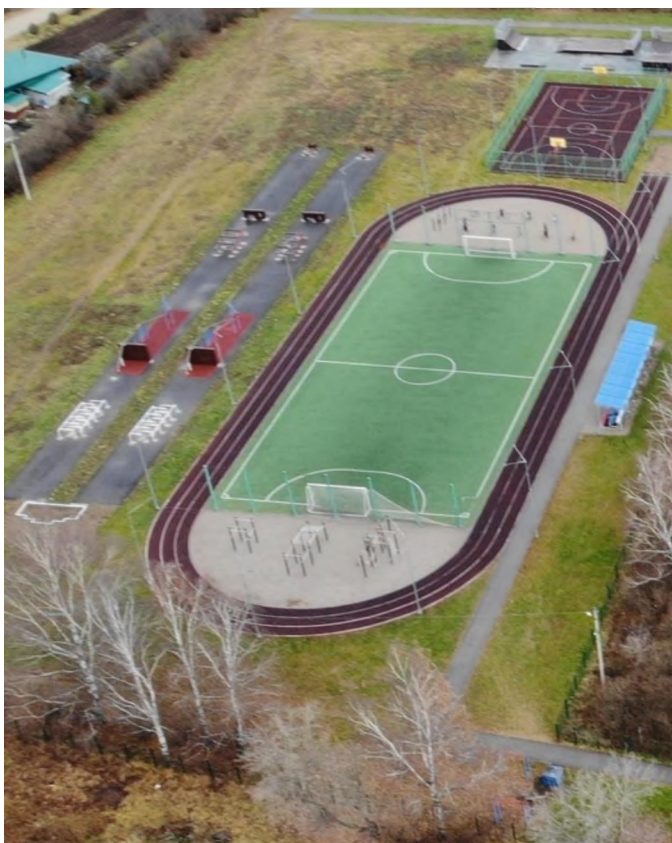
Рисунок – место проведения тактической игры на местности