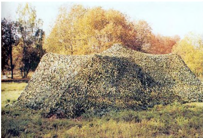
Рисунок – маскировка объекта с изменением контура.

После расположения маскировочной сети под нее в произвольном порядке подставляются большие кольца с помощью которых изменяется контур. Эти кольца не углубляются в землю, а держатся за счет натяжения сети.